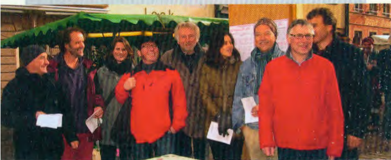
UnterstützerInnen der DOL bei der Arbeit ... Informationsstand auf dem Marktplatz mit sichtlich guter Laune und nach vielen guten Gesprächen.

Meist am Donnerstag nach der Gemeinderatssitzung, aktuelles auf der Homepage und in der Tagespresse.