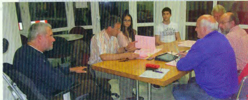
Öffentliche Fraktionssitzung im Generationenbüro im Rathaus-Innenhof

Donnerstags, 19:30 Uhr, Generationenbüro im Rathaus-Innenhof (außer an den Plenumstagen)